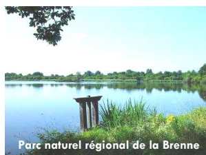
Parc naturel régional de la Brenne

Une Opération Programmée de Restauration de l'Habitat (OPAH) a d'autre part été mise en place dans le but de favoriser auprès des artisans et des propriétaires la conservation et la préservation du patrimoine, de contribuer à la mise aux normes des systèmes d'assainissement, de promouvoir les énergies renouvelables et les économies d'énergie, et l'utilisation de matériaux d'origine locale.