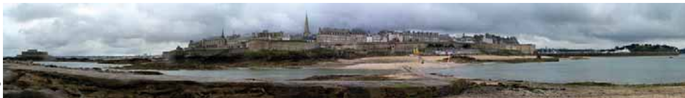
Saint-Malo vu depuis l'île du Grand Bé, capitale du Pays de Saint-Malo, à cheval entre les départements d'Ille-et-Vilaine, des Côtes-d'Armor et du Morbihan.