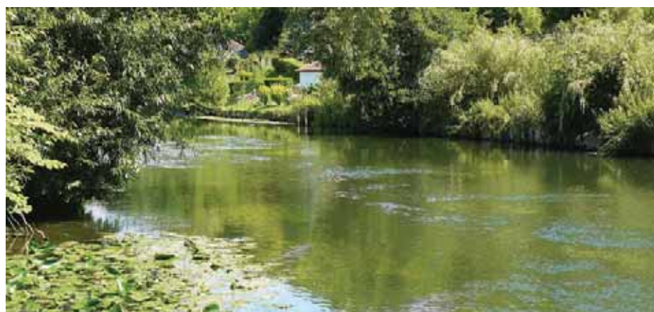
La rivière Eure à Marcilly-sur-Eure, dans le Pays Drouais, une région naturelle située autour de la ville de Dreux, principalement en Eure-et-Loir.

La création du Pays a permis de redonner un peu de dynamisme au territoire en le rendant attractif : malgré l'exode rural et le déclin démographique des dernières décennies, il connaît depuis les années 2000 un nouvel essor avec le rajeunissement et l'accueil de nouvelles populations !